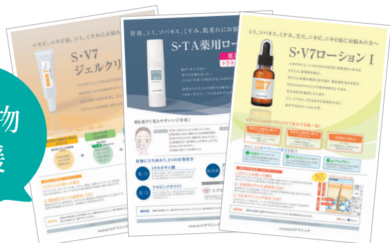
※販促チラシイメージ